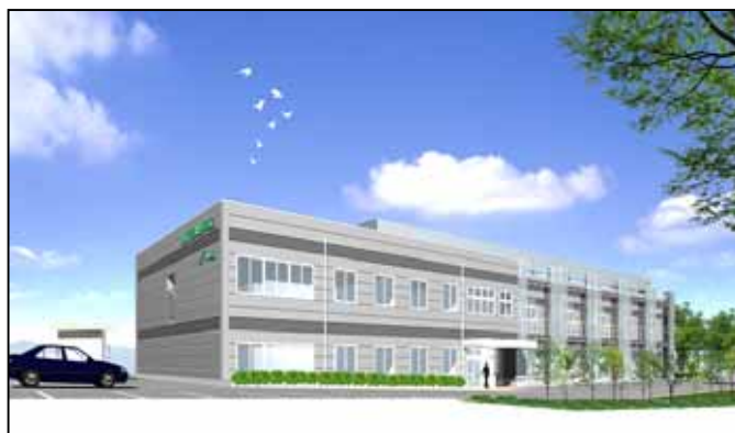
施設イメージパース(案)

「ベンチャープラザ船橋」は、中小機構が、経済産業省、千葉県及び船橋市等と連携して、皆様の起業や創業活動、企業の新事業展開等を総合的に支援するための施設です。