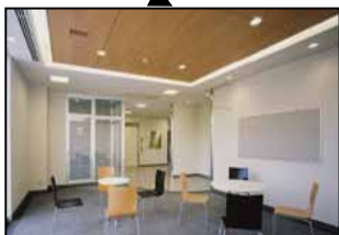
交流ラウンジ（イメージ）

事業主体・運営主体 （独）中小企業基盤整備機構 整備場所 船橋市北本町1丁目 （JR船橋駅から北へ約1km） 施設規模 延床面積 約2,400㎡ （地上2階建て） 敷地面積 約3,300㎡ 施設内容 研究室（ウェットラボ） オフィス 会議室 交流ラウンジ 駐車場 等