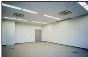
オフィス（イメージ）